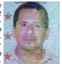
"Yo soy Gringo ...Y qué?"